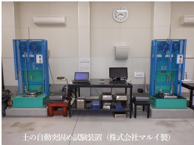
土の自動突固め試験装置 (株式会社マルイ製)